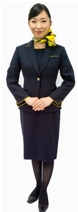
(ジャケット・ワンピース着用)