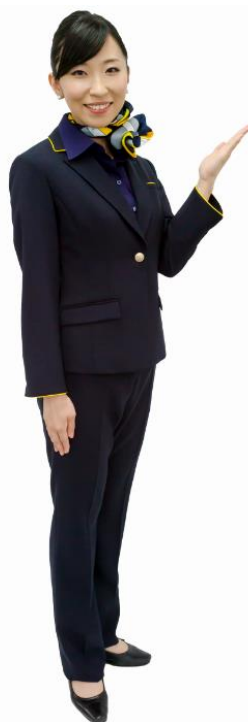
(ジャケット・パンツ着用)