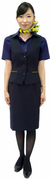
(ベスト・スカート着用)