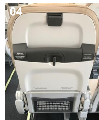
01:機内(前方から)／02:機内(後方から)／03:座席上の収納棚／04:シート背面