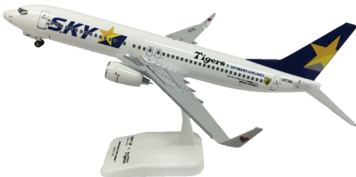
(1/130 スケール・全長約 30cm)